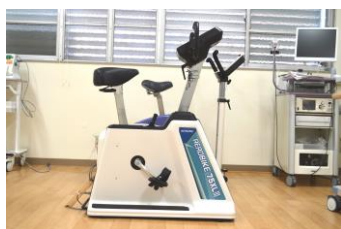
CPX (心肺運動負荷試験)