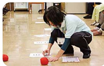
体力測定「球投げ」 平成25年11月23日～25日まで