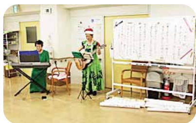
ババースバンド「ラ・マンマ」 平成25年12月24日