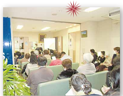
多くの方が参加してくださいました