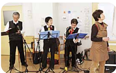
ハーモニカグループ「夢街道」 平成26年1月14日