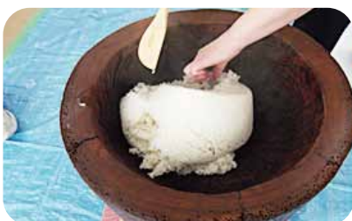
餅つき 平成26年1月22日