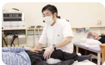
理学療法士による 個別リハビリ